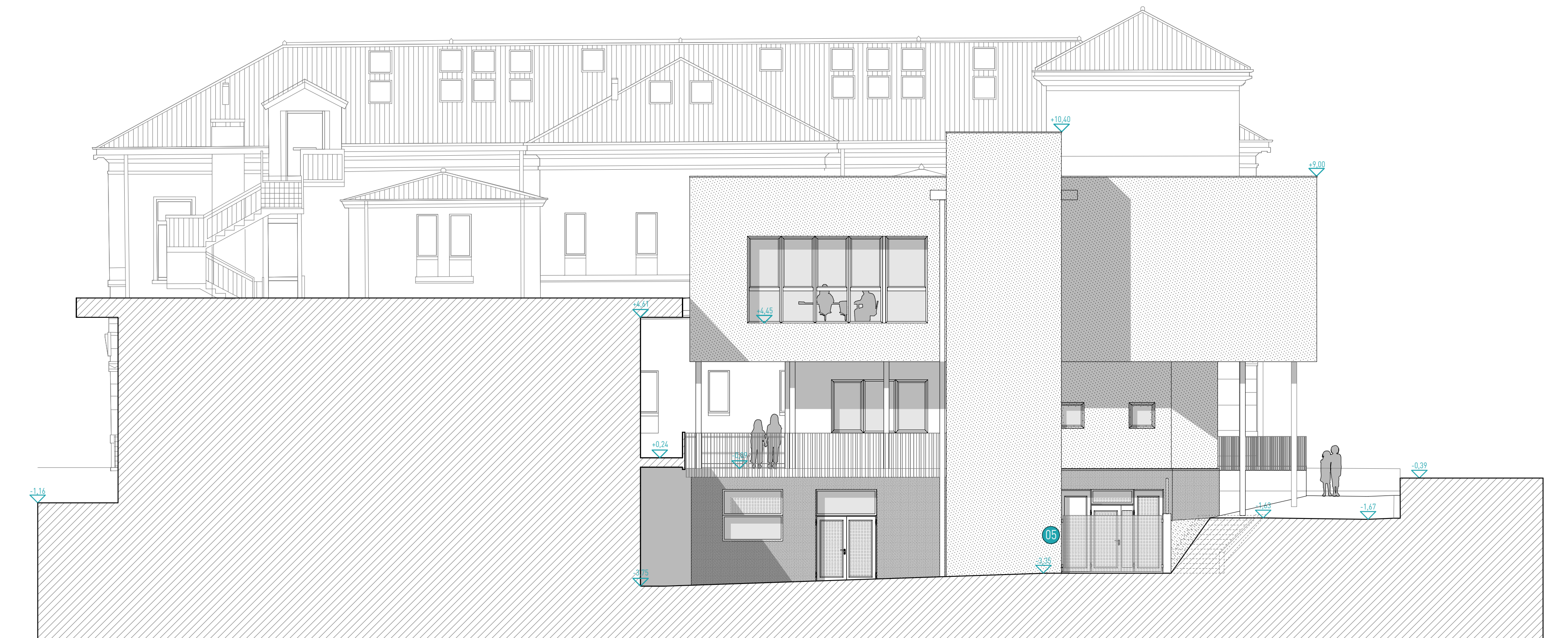
PROSPETTO NORD SCALA 1/100